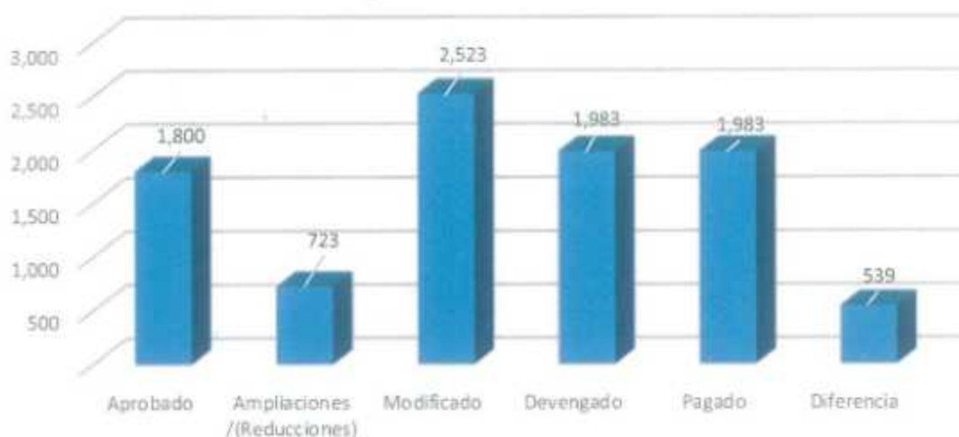
Ejercicio del Presupuesto de Egresos Ejercicio Fiscal 2022

El presupuesto de egresos aprobado para el Instituto de Planeación del Desarrollo Urbano del Municipio de Benito Juárez, Quintana Roo, es por la suma de 1,800 miles de pesos, ese importe, fue modificado mediante ampliaciones y reducciones líquidas presupuestales durante el año 2022, con un efecto neto igual a 723 miles de pesos; integrado de la siguiente manera: 273 miles de pesos correspondiente al remanente del ejercicio 2021, a su vez en noviembre de 2022 la Tesorería Municipal otorgó una ampliación al presupuesto del Instituto de 450 miles de pesos. Del monto se devengó la cantidad de 1,983 miles de pesos en el año fiscal del que se rinde cuenta en este informe.